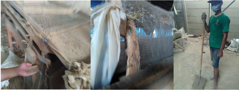
Perbaikan pada screening dan sekop