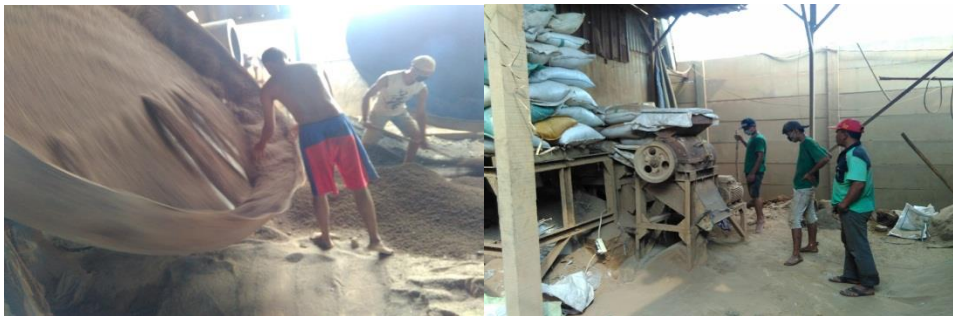
Proses granulasi dan crusher