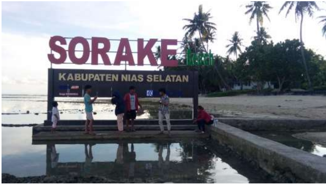
Gambar 3. Gapura Sorake