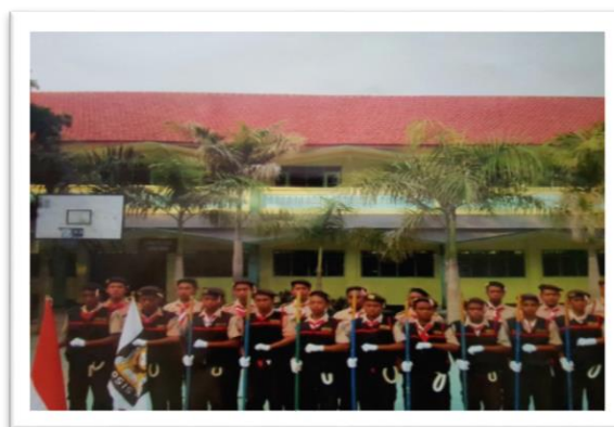
GUGUS DEPAN SMK GAJAH MADA