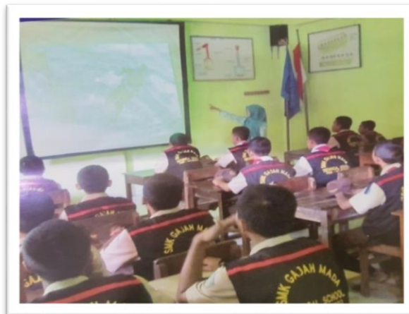
Kegiatan belajar mengajar yang tertib