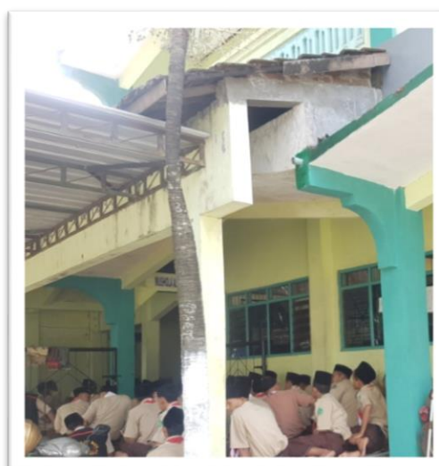
Wajib mengikuti sholat berjamaah