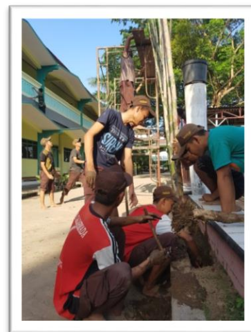
Membersihkan dan merawat lingkungan sekolah