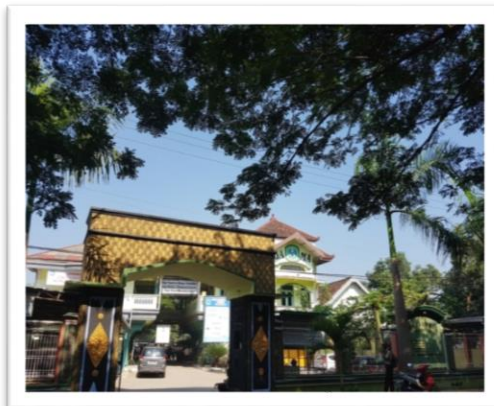
Gambar bagian depan SMK GAJAH MADA