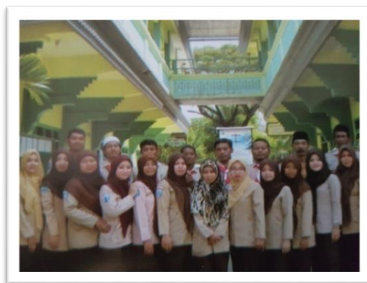
Para Guru dan staf karyawan SMK GAJAH MADA