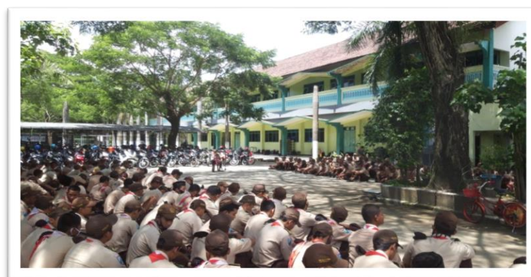
Kegiatan wajib pramuka untuk membentuk karakter siswa