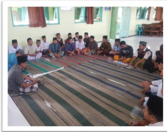
Rutinan tahlil dan do'a bersama