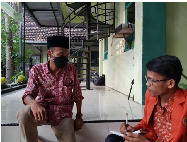
Wawancara dengan Waka Kesiswaan