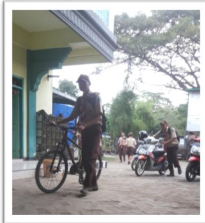
Turun dari kendaraan ketika memasuki lingkungan sekolah